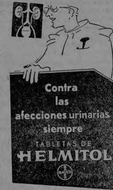
Contra las afecciones urinarias siempre TABLETAS DE HELMITOL

Acogidos a la benevolencia de esa empresa, le rogamos muy atentamente insertar en ese importante rotativo la invitación siguiente: "Se avisa a la afición deportiva, que el próximo domingo 27 de los corrientes, se efectuará un match de foot ball a las doce y treinta horas en la plaza Iglesias de Cartago, entre los equipos "BRUMOSO" de aquella ciudad y el "MARCONI" de esta capital. Por ser ambos bandos compuestos de jugadores exclusivamente del ramo de telégrafos, este encuentro a despertado gran entusiasmo entre el ele-