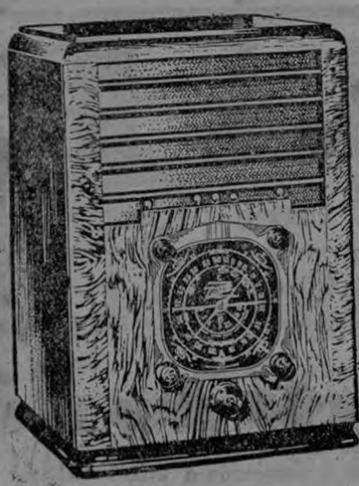
Model No. 6-S-128

El Radio más imitado del mundo Siempre Años a la Vanguardia