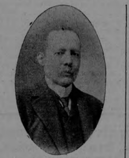
Lic. don Ascensión Esquivel Presidente de la República 1902-1906

Hará mañana 35 años que fueron rematados ante el señor Presidente de la República, don Rafael Yglesias Castro, los detalles de la llamada transacción política entre los partidos Civil y Republicano.